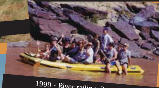
1999 - River rafting, Zastron