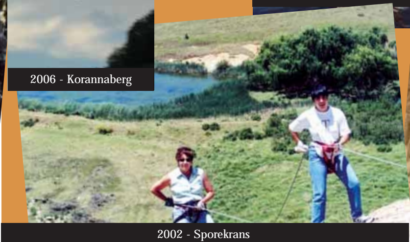
2002 - Sporekrans