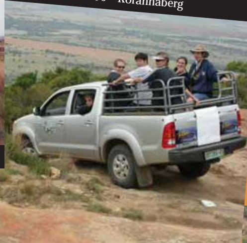
2006 - Korannaberg