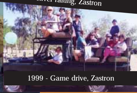
1999 - Game drive, Zastron