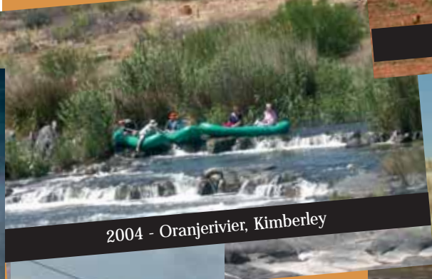
2004 - Oranjerivier, Kimberley