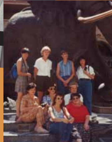
1997 - Sun City & Lost City