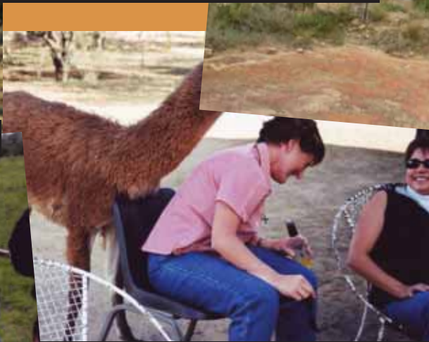
2003 - Mabula Lodge