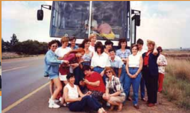
1997 - Sun City & Lost City