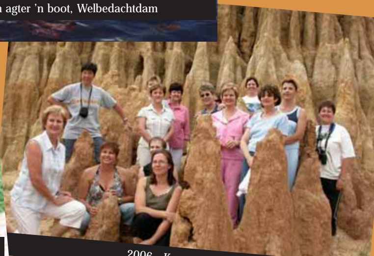
2006 - Korannaberg