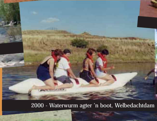
2000 - Waterwurm agter 'n boot, Welbedachtam