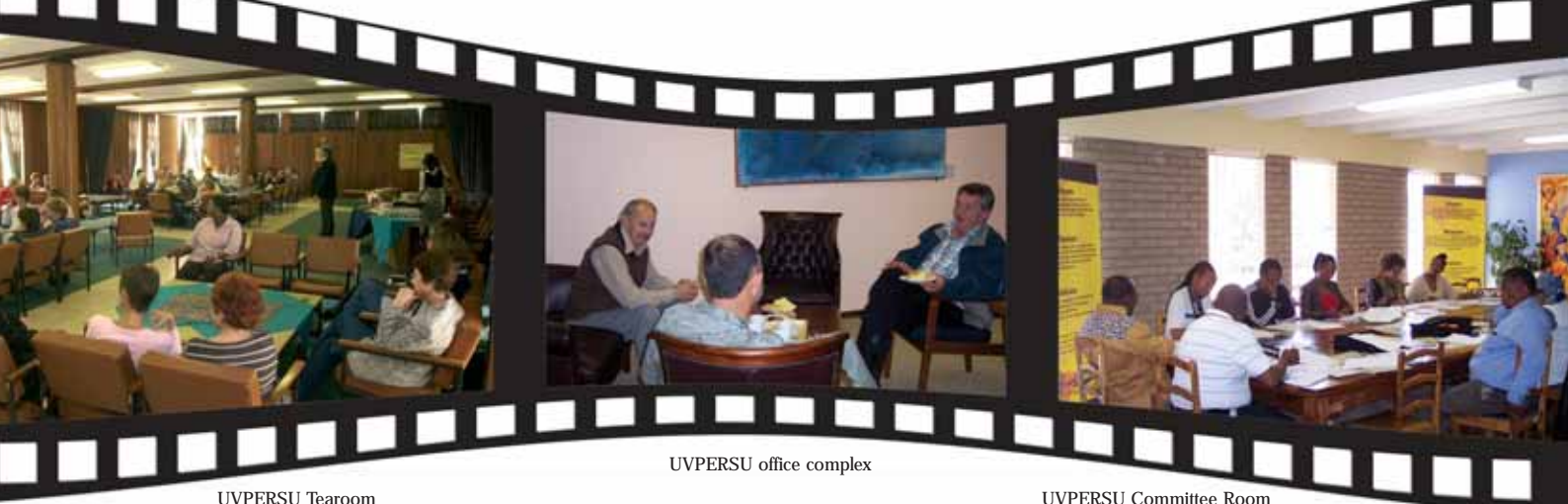
UVPERSU office complex