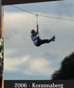
2006 - Korannaberg