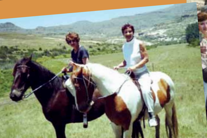
2002 - Sporekrans