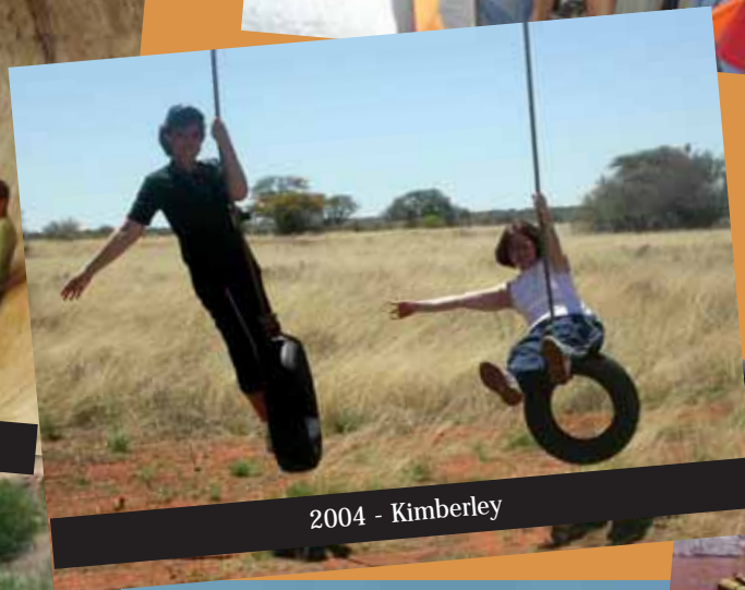
2004 - Kimberley